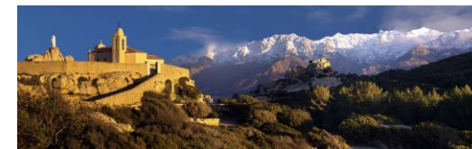
Calvi – Notre Dame de la Serra

16h30 : Tournoi SimultaNet, avec handicap, l'avantage de points d'expert en nombre accru et du commentaire des douze meilleures donnes par l'équipe Soulet / Devèze. Au classement