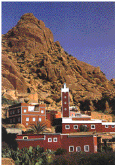
Village de Tiznit, un des buts d'excursion

Envie d'un peu de soleil au cœur de l'hiver, Agadir vous ouvre grand les portes du Sud Marocain. Ville moderne, plus grande station balnéaire du Maroc, Agadir est toujours attirante à cette période de l'année, où la plage immense reste bien souvent très ensoleillée, et où le ciel est d'un bleu limpide qui met en valeur l'ocre rouge de l'architecture traditionnelle marocaine.