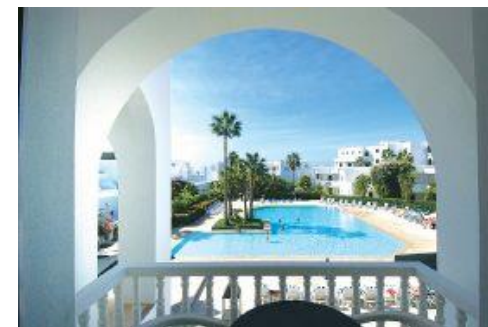
Hôtel Tafoukt Beach, directement sur la plage

Soirée de Réveillon. Faisons confiance au sens de la fête des Marocains pour nous offrir une belle soirée de fin d'année.