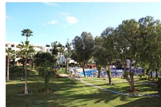
Jardins de l'hôtel Almohades

16h30 BRIDGE: Tournoi en I.M.P. Se joue par paires, mais avec la marque et l'esprit du bridge par équipes